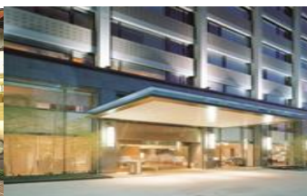
水美Sweetme Hot spring Resort